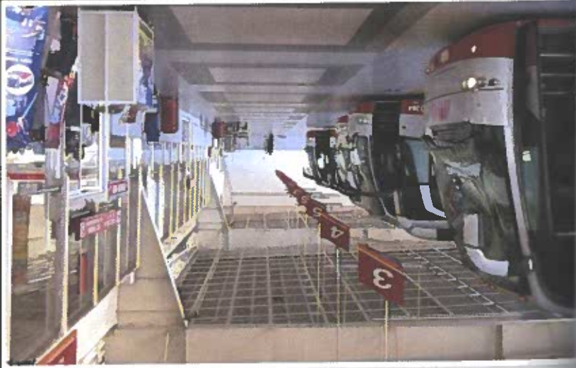
Adios, Querétaro, hasta la próxima.

¿Quieres ir tú a Querétaro algún día? ¿Por qué?