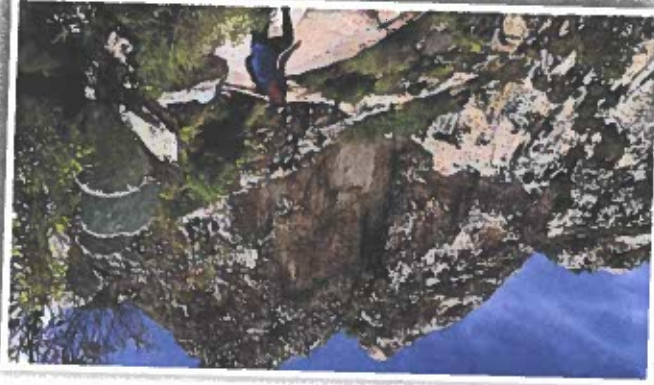
la Peña de Bernal, una vista hermosa