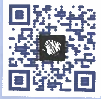
Chapter 10 audio